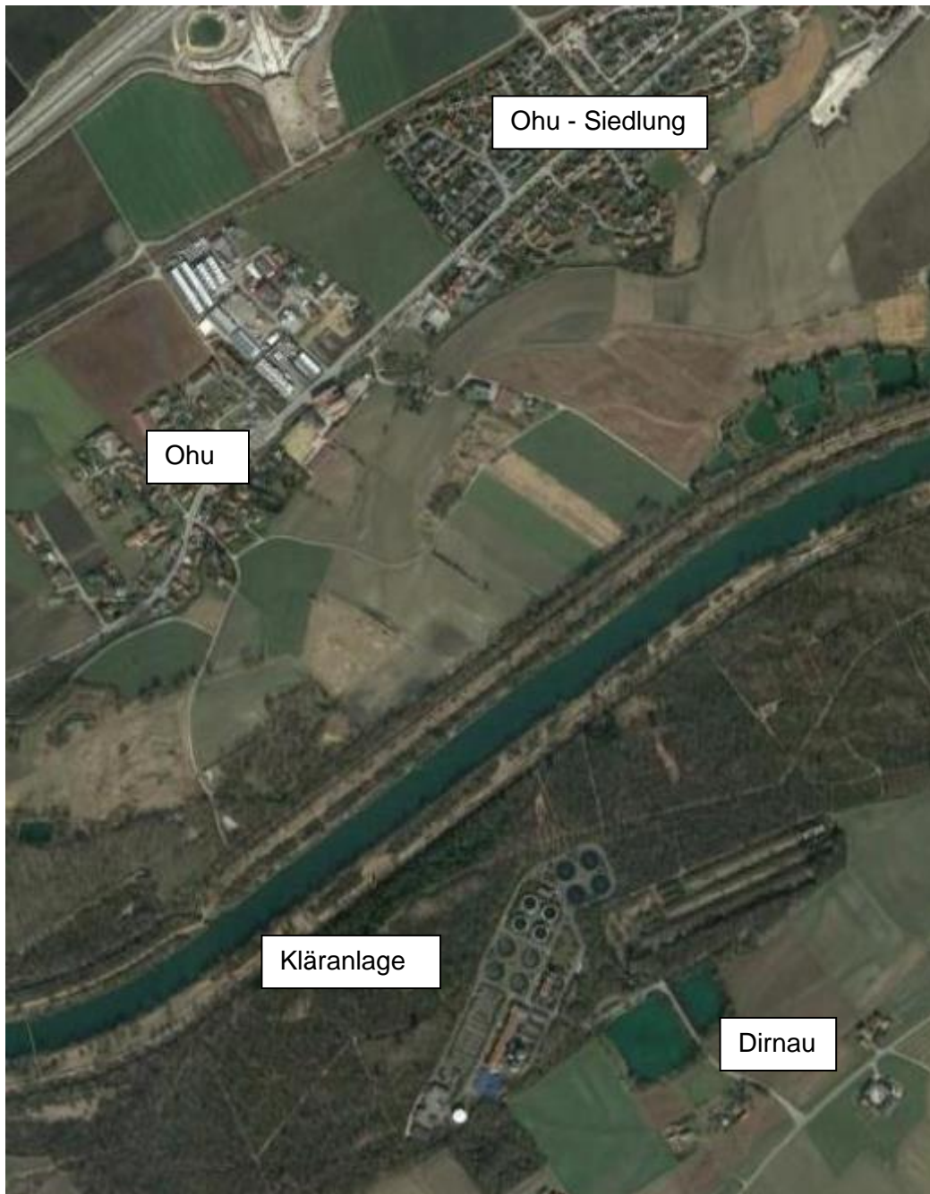
Abbildung 1: Untersuchungsraum der Neubaumaßnahme, genordet

Der Untersuchungsraum erstreckt sich zwischen der A 92 am Kreuz Landshut und der Kreisstraße LAs 14. Die Maßnahme befindet sich im Bereich der Ortslagen Ohu und Ohu-Siedlung bei Landshut und dem Ort Dirnau.