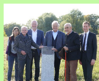
Einweihung der neuen Gedenktafel zum 20-jährigen Jubiläum des Naturschutzgebietes mit den Ehrengästen

Einige Eindrücke der Feier sowie ergänzende Interviews finden Sie in: Mediathek Niederrhein TV (von ca. Minute 10 - 14 in der Sendung NIEDERBAYERN TV Journal vom 17.10.2021).