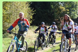
Radfahren mit den Woidboyz durch Haidmühle & die Bischofsreuter Waldhufen