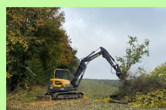
Bei der Heckenpflege im Einsatz: Bagger mit Zwickzange

Hecken sind wichtige Lebensräume und prägen die niederbayerische Kulturlandschaft. Sie müssen aber auch gepflegt werden. Dieses Thema stieß im Landkreis Landshut auf großes Interesse. Rund 60 Teilnehmer – Landwirte, Bauhofmitarbeiter, Vertreter verschiedener Verbände – kamen zum ersten Landshuter Heckenpflegetag am 28.10.2021 nach Buch am Erlbach. Organisiert wurde der Tag von der Wildlebensraumberatung am Amt für Ernährung,