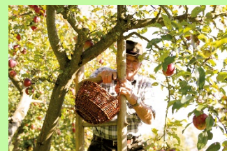
Streuobstwiesen aus dem „Netzwerk Streuobst Bayerischer Vorwald“ im Landkreis Straubing-Bogen und Obstbauer bei der Ernte