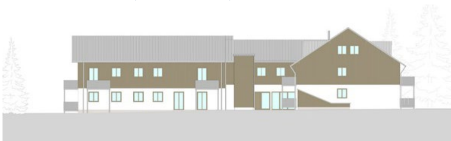
Ansicht des Gebäudes mit elf seniorengerechten Mietwohnungen (ehemalige Jugendherberge Mauth) vom Architekturbüro konzept a+.

Mehr Best-Practice-Bespiele in Niederbayern sind hier aufrufbar.