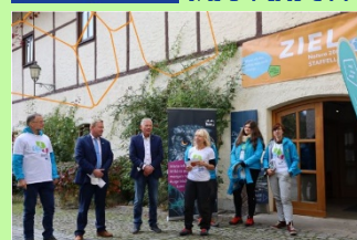
Wandern im Ilztal mit Mr. Goldsteig, Ziel Schloss Fürsteneck